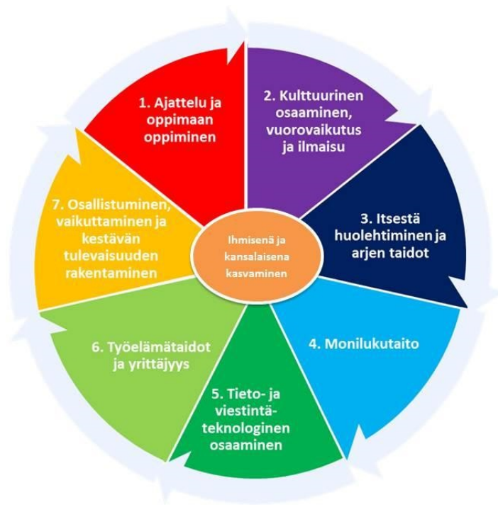
Kuva: Laaja-alainen osaaminen