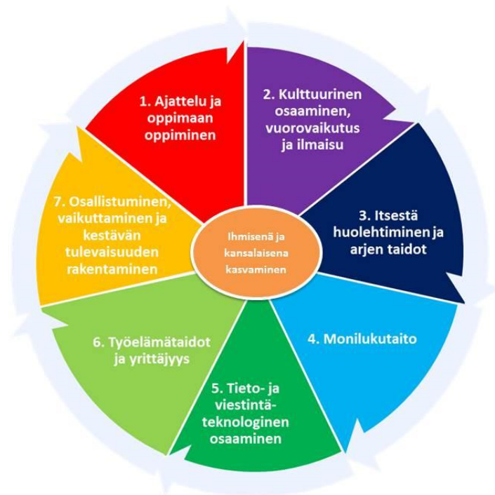
Kuva: Laaja-alainen osaaminen

Perusopetuksen aikana oppilaat pohtivat menneisyyden, nykyisyyden ja tulevaisuuden välisiä yhteyksiä sekä erilaisia tulevaisuusvaihtoehtoja. Heitä ohjataan ymmärtämään omien valintojen, elämäntapojen ja tekojen merkitys paitsi itselle, myös lähiyhteisöille, yhteiskunnalle ja luonnolle. Oppilaat saavat valmiuksia sekä omien että yhteisön ja yhteiskunnan toimintatapojen ja -rakenteiden arviointiin ja muuttamiseen kestävää tulevaisuutta rakentaviksi.