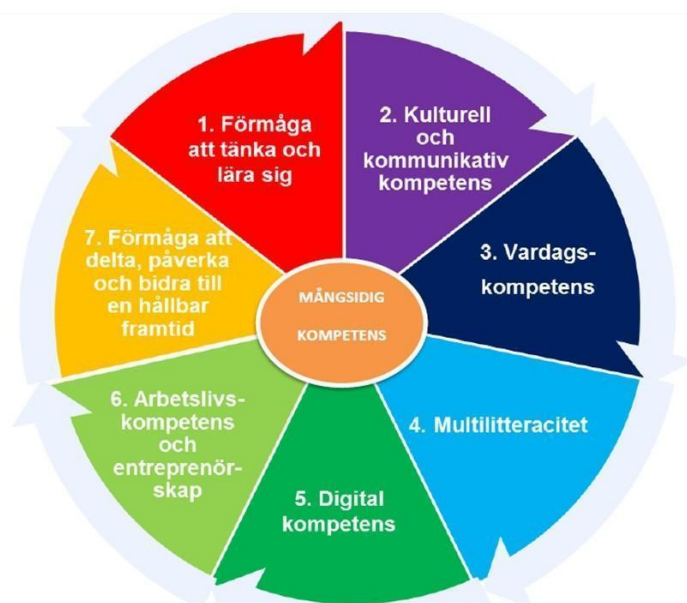
Bild: Mångsidig kompetens

Under den grundläggande utbildningen ska eleverna fundera över sambandet mellan det förflutna, nutiden och framtiden samt olika framtidsalternativ. De ska lära sig förstå betydelsen av sina val, levnadssätt och handlingar, inte bara för det egna livet, utan även för den närmaste omgivningen, samhället och naturen. Eleverna ska få färdigheter att utvärdera och förändra både sina egna, skolans och samhällets förfaringsätt och verksamhetsstrukturer så att de bidrar till att bygga en hållbar framtid.