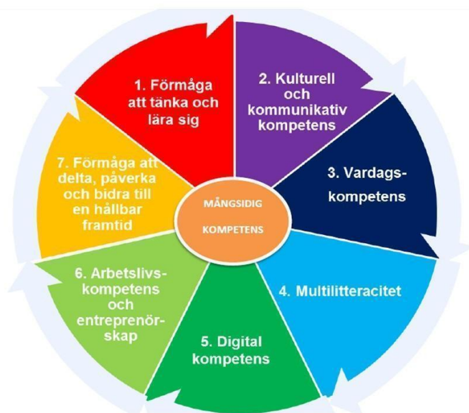
Bild: Mångsidig kompetens

Under den grundläggande utbildningen ska eleverna fundera över sambandet mellan det förflutna, nutiden och framtiden samt olika framtidsalternativ. De ska lära sig förstå betydelsen av sina val, levnadssätt och handlingar, inte bara för det egna livet, utan även för den närmaste omgivningen, samhället och naturen. Eleverna ska få färdigheter att utvärdera och förändra både sina egna, skolans och samhällets förfaringsätt och verksamhetsstrukturer så att de bidrar till att bygga en hållbar framtid.