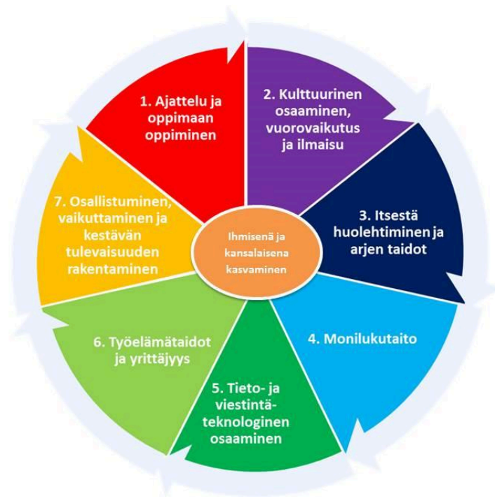
Kuva: Laaja-alainen osaaminen

Perusopetuksen aikana oppilaat pohtivat menneisyyden, nykyisyyden ja tulevaisuuden välisiä yhteyksiä sekä erilaisia tulevaisuusvaihtoehtoja. Heitä ohjataan ymmärtämään omien valintojen, elämäntapojen ja tekojen merkitys paitsi itselle, myös lähiyhteisöille, yhteiskunnalle ja luonnolle. Oppilaat saavat valmiuksia sekä omien että yhteisön ja yhteiskunnan toimintatapojen ja -rakenteiden arviointiin ja muuttamiseen kestävää tulevaisuutta rakentaviksi.