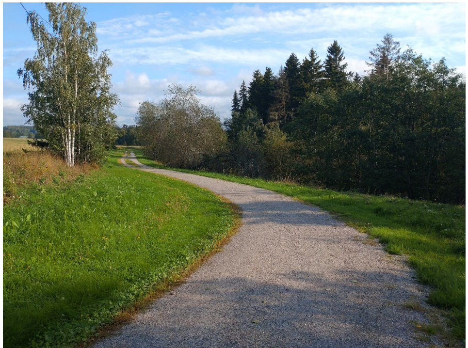
Kuva 5: 1980-luvulla on rakennettu valaistu ulkoilureitti purolaakson itäpuolen reunalle (kuva syyskuu 2024). Uusi ulkoilureitti olisi valmistuessaan samanlainen.

Alueen pohjavesi muodostuu pääasiassa laaksoa ympäröivillä kallioalueilla. Savimaalla tapahtuva rakentaminen ei siten vaikuta pohjaveden muodostumiseen, ja vielä vähemmän hyvin vettä läpäisevä kivituhkapintainen ulkoilureitin rakenne.