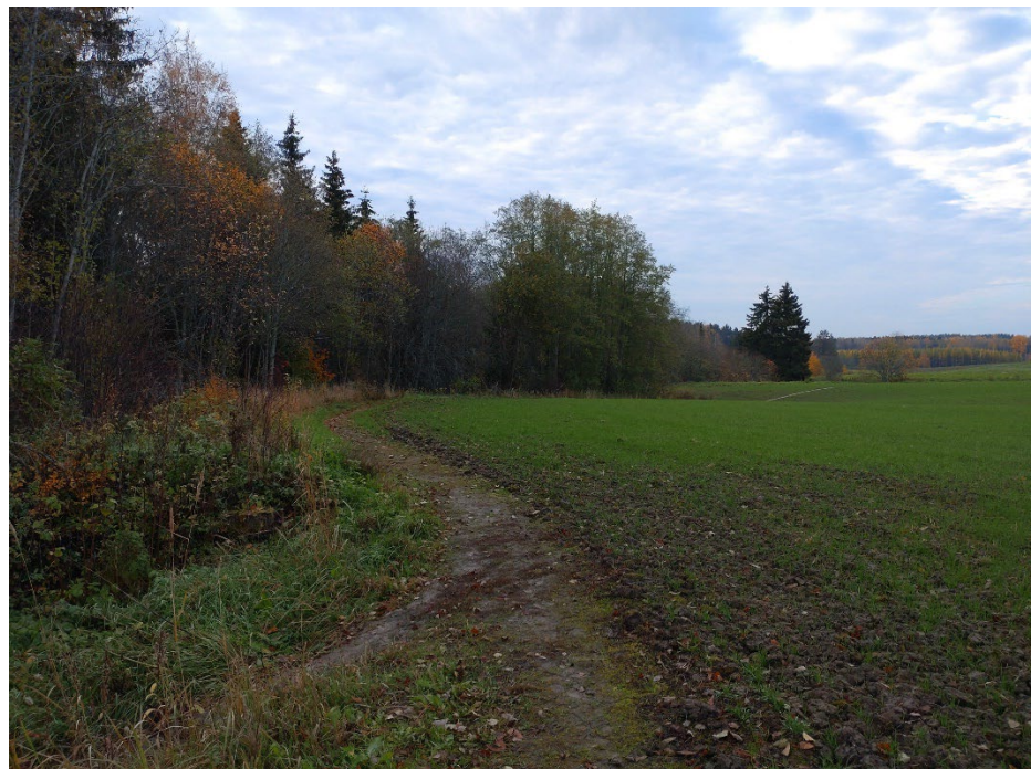
Kuva 4: Valokuva vuodelta 2021 kohdasta, johon ulkoilureitti on rakennettu. Pellolla ei ole suojavyöhykettä ja ulkoilureitti on rakennettu kuvassa näkyvän polun oikealle puolelle. (Kuva on suurin piirtein samasta kohdasta kuin hallintopakkohakemuksen sivulla 14.)

Kaava-asiakirjoissa on viitattu vesistöjen suojavyöhykkeisiin, jotka lasketaan alkavan uomasta. Kaava-asiakirjoissa ei ole tarkoitettu maanviljelyyn liittyviä suojavyöhykkeitä, jotka taas lasketaan viljelemättä jätetystä alueesta.