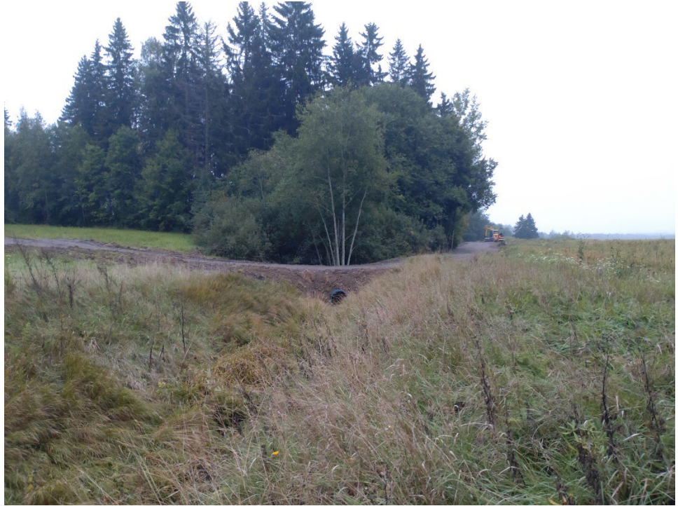
Kuva 3: Uusi siltarumpu on asennettu pelto-ojaosuuteen, kuva syyskuussa 2024.