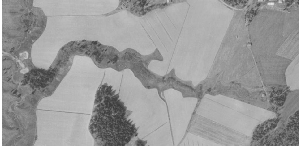
Kuva 2: Gretasbäcken ilmakuvasa vuonna 1965. Pohjoinen oikealla.