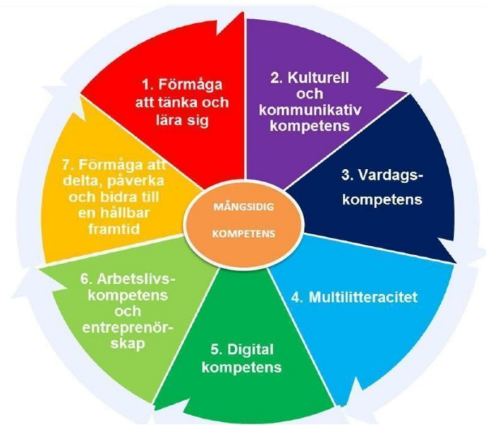
Bild: Mångsidig kompetens